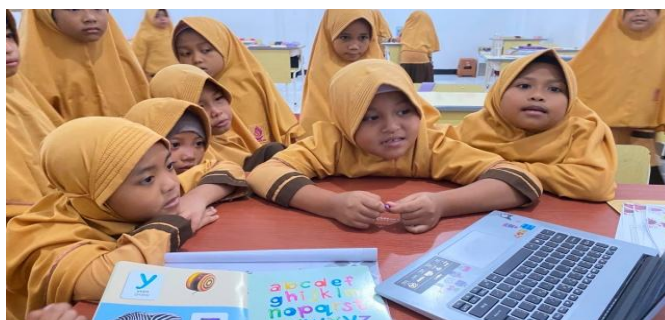
Gambar 3. Kegiatan Pembelajaran Membaca Permulaan Menggunakan Metode Fonik Berbantuan Video YouTube dan Kartu Bergambar

mudah mengenali bunyi huruf, mengeja suku kata, serta membaca kata sederhana secara bertahap.