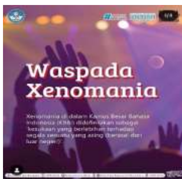
Gambar 6. Xenomania

Konten diposting pada tanggal 23 April 2025 Istilah “ xenomania ” termasuk ke dalam pengembangan bahasa karena merupakan kosakata serapan yang digunakan untuk menjelaskan sikap berlebihan dalam mengagungkan budaya asing. Penggunaan istilah ini memperkaya kosakata bahasa Indonesia dalam bidang sosial dan budaya. Selain itu, istilah tersebut membantu masyarakat memahami fenomena