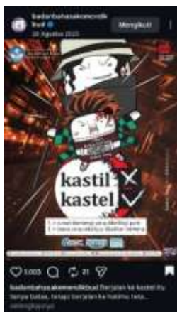
Gambar 5. Kastil dan kastel

Konten ini diposting tanggal 28 Agustus 2025 Kata “ kastil dan kastel ” termasuk ke dalam pembinaan bahasa karena konten tersebut bertujuan memberikan edukasi kepada masyarakat mengenai bentuk kata yang baku dan benar sesuai kaidah bahasa Indonesia. Dalam hal ini, bentuk yang benar menurut KBBI adalah “ kastel ”. Konten seperti ini berfungsi untuk membimbing masyarakat untuk memanfaatkan bahasa Indonesia yang sesuai dengan aturan kebahasaan dalam komunikasi sehari-hari. Oleh karena itu, data ini termasuk pembinaan bahasa karena berfokus pada perbaikan penggunaan kata.