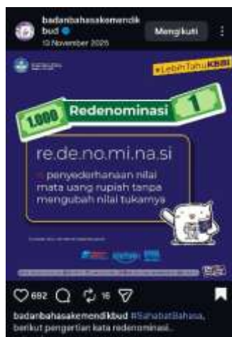
Gambar 4. Redenominasi

Konten ini diposting pada tanggal 13 November 2025 Istilah “ redenominasi ” termasuk ke dalam pengembangan bahasa karena merupakan istilah serapan yang digunakan dalam bidang ekonomi. Kata ini menunjukkan bahwa bahasa Indonesia terus berkembang dengan menyerap istilah asing yang disesuaikan dengan kebutuhan ilmu pengetahuan dan komunikasi modern. Kehadiran istilah tersebut membantu masyarakat memahami konsep ekonomi secara lebih mudah dalam bahasa Indonesia tanpa harus selalu menggunakan istilah asing secara langsung.