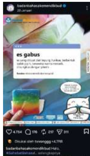
Gambar 2. Es gabus

Konten ini diposting pada tanggal 29 Januari 2026. Istilah “ es gabus ” termasuk ke dalam pengembangan bahasa karena merupakan kosakata yang berasal dari budaya lokal dan digunakan dalam kehidupan masyarakat. Kata ini menyatakan bahwa bahasa Indonesia berkembang melalui keberadaan istilah kuliner tradisional yang diwariskan secara turun-temurun. Penggunaan istilah tersebut juga menjadi bentuk pelestarian budaya lokal melalui bahasa, sehingga kosakata daerah atau tradisional tetap dikenal oleh masyarakat luas.