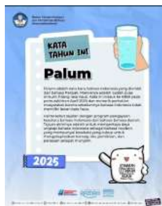
Gambar 3. Palum