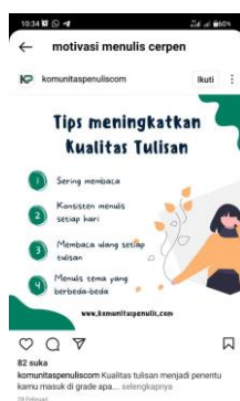
Gambar 2. Tampilan yang memuat postingan tips atau cara untuk meningkatkan kualitas menulis. Pada akun @komunitasmenuliscom.

Dari gambar 1 dapat terlihat tampilan postingan pada akun Instagram @mazayapublishinghouse. Dari gambar tersebut terlihat ada beberapa hal yang bisa menjadi motivasi seseorang untuk (terus menulis). Seperti Aktualisasi diri, berbagi ilmu, wawasan, menghibur, self healing, dan sebagainya. Lewat beberapa tulisan tersebut bisa membuat seseorang semakin yakin bahwa dirinya bisa menjadi seorang penulis yang baik.