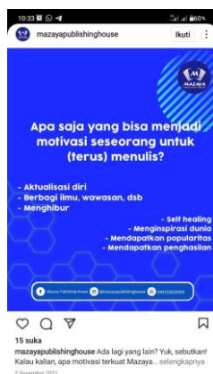
Gambar 1. Tampilan yang memuat postingan motivasi seseorang untuk terus menulis. Pada akun @mazayapublishinghouse.

Lewat Instagram seseorang bisa meningkatkan minat menulisnya, dengan menuliskan kata kunci apa yang ingin dicari di laman pencarian, tinggal tunggu beberapa detik maka akan menampilkan sejumlah postingan-postingan yang memberikan sebuah informasi.