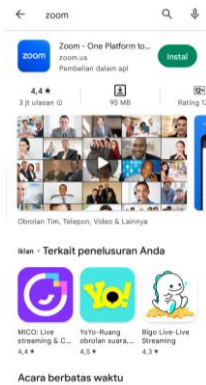
Gambar 1. Instal zoom