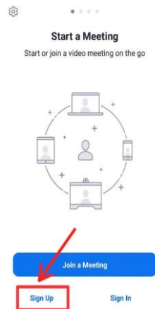
Gambar 2. Tampilan awal pada aplikasi zoom