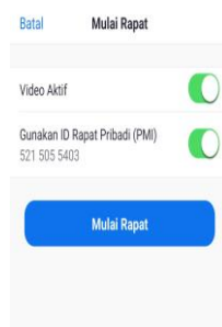
Gambar 5. Menu mulai rapat

d) Klik start a new meeting (mulai rapat)