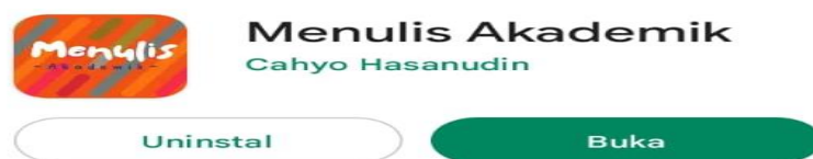
Gambar 1. Tampilan di menu Play Store