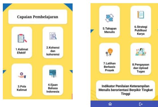
Gambar 4. Tampilan menu isi