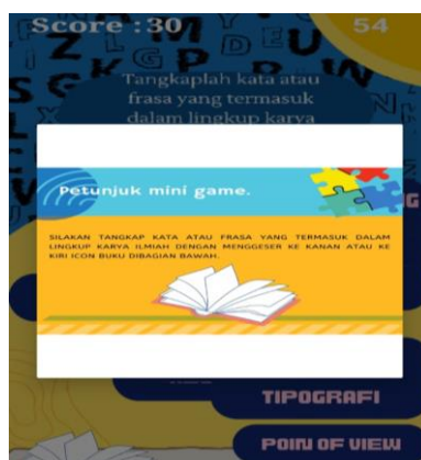
Gambar 5. Tampilan menu permainan

Penjelasan di atas diuraikan oleh percobaan yang dilakukan penulis dalam memanfaatkan aplikasi “Menulis Akademik” sebagai penunjang pembelajaran keterampilan menulis di perguruan tinggi. Aplikasi ini begitu bermanfaat bagi pengguna yang masih awam terkait keterampilan menulis akademik. Di sisi lain, pemakaiannya yang mudah tentu saja dapat menjadi poin yang baik untuk pengguna aplikasi pemula.